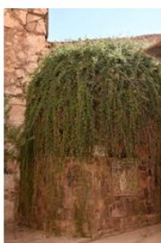
صورة رقم (6): شجرة الطيبة داخل دير سانت كاترين

تم تجهيز المدقات والطرق في جبل موسى وكذلك اللافتات الإرشادية بمواد محلية تتلائم وطبيعة المنطقة وتبتعد عن المدنية الغير مطلوبة في تلك المحمية ذات الطبيعة الخاصة، كذلك توفر الاستراحات المنتشرة بطول الطريق والمقامة بمواد محلية دورات مياه وكافتريات ومحال تجارية كخدمات للسائح. خدمة استنجاز الجمال توفر مشقة السير لكبار السن والمعاقين، الا انها تقف عند حد معين ويلزم عندها صعود القمة عبر 750 درجة وهو مايشكل صعوبة على تلك الفئات.