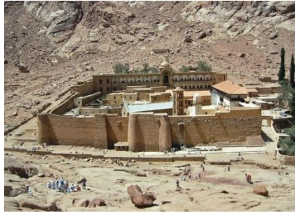
صورة رقم (1): دير سانت كاترين بسيناء

في عام 2002 قامت منظمة اليونسكو بتسجيل المنطقة على لائحة التراث العالمي، لتصبح عدد المناطق التراثية والطبيعية المسجلة في مصر سبعة مناطق.[8]