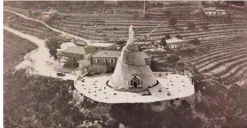
صورة رقم (14): صورة قديمة لمزار سيدة لبنان

تم تصنيع تمثال السيدة العذراء في مدينة ليون الفرنسية وتم نقله لميناء بيروت في 1906، عبارة عن 7 قطع من البرونز. يبلغ ارتفاع التمثال 8.5 متر، وبقطر 5 متر، ويزن 15 طن، وتم طلائه باللون الأبيض، ويرتكز التمثال على قاعدة مخروطية من الحجارة "مبنى الكنيسة" والذي يتسع ل 100 مصلى ويبلغ ارتفاعها 20 متر، ويمكن للزوار الصعود للتمثال من خلال الدرج اللولبي المكون من 104 درجة.[6]