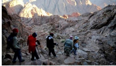
صورة رقم (3): رحلة الهبوط من قمة جبل موسى عقب الشروق