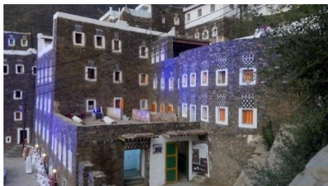
صورة رقم (10): الطراز المعماري لمباني القرية