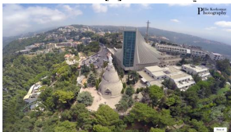
رقم الصورة (15): لقطة جوية لمزار سيدة لبنان يظهر تمثال العذراء والبازيليك، المصدر: http://www.ololb.org/portfolio/harissa-fr-elie-korkomaz

في مايو 1970، تم وضع حجر الأساس لبناء كنيسة جديدة " البازيليك " تم تصميمها على هيئة سفينة فينيقية تتسع ل3500 مصلي مجاورة للكنيسة التراثية لتستوعب الاعداد الكبيرة من المصلين التي لا تستطيع استيعابها الكنيسة التراثية مخروطية الشكل، حيث تم البدء سريعا في اعمال البناء دون توقف وتم الانتهاء من الاساسات في يونيو 1971. [6]