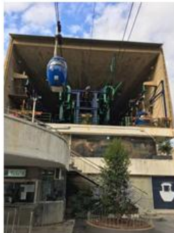
صور رقم (18)، (19): الصورة على اليمين لمحطة تلفريك جونيه، الصورة على اليسار لباص التلفريك الأحمر، المصدر: الباحث