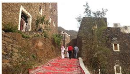
صورة رقم (12): المنحدرات داخل القرية

فور الوصول للقرية تقوم الباصات بالوقوف خارج القرية، ويبدأ الزوار للتجول في القرية ومبانيها وحصونها مشيا على الأقدام، عبر ممرات وطرق القرية ذات المناسيب المختلفة من خلال المنحدرات ودرجات السلالم. [16]