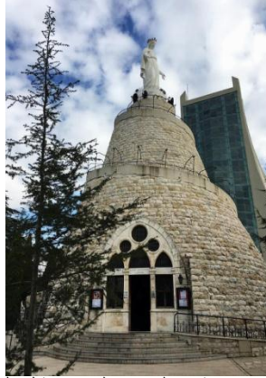
صورة رقم (13): كنيسة ام النور يعلوها تمثال العذراء

تتكون البيئة التراثية لمزار سيدة لبنان من أربع كنائس أهمها كنيسة أم النور المارونية مخروطية الشكل والتي يعلوها تمثال من البرونز للسيدة العذراء مريم. تم وضع حجر الأساس في أكتوبر 1904، ولم يتم البدء سريعا في البناء نظرا لقصور الموارد المالية المتوفرة لتمويل المشروع وخوفا من عدم ثبات التربة نظرا لاحمال الضخمة المتوقعة من البناء في تلك المنطقة الجبلية. تكلف انشاء الكنيسة والتمثال مايقرب من 50000 فرانك ذهبي فرنسي، تم تجميعها من خلال المتبرعين ابرزهم سيدة فرنسية غير معروفة تبرعت ب 16000 فرانك. وتمت الموافقة على بناء المشروع من خلال فرمان اصدره السلطان العثماني في ذلك الوقت.[7]