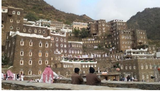
صورة رقم (8): مباني قرية رجال المع

تتميز البيئة التراثية بالقرية بمبانيها الحجرية ذات طراز معماري فريد لواجهاتها التي يزينها حجر المرو الأبيض "الكوارتز" ويزين الفتحات من أبواب ونوافذ، ويتميز تخطيط القرية بتراطبات مبانيها ببعض وتناسجها رغم اختلاف ارتفاعاتها التي تتراوح من ثلاثة الى خمسة أدوار واختلاف مناسبيها التي خلفتها الطبيعة الجبلية للمنطقة، كما روعي في تصميم القرية اعتبارات تصريف مياه السيول. [14]