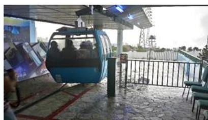
صورة رقم (11): تلفريك السودة