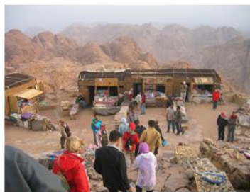
صورة رقم (5): منطقة الاستراحة والخدمات بقرش اليا