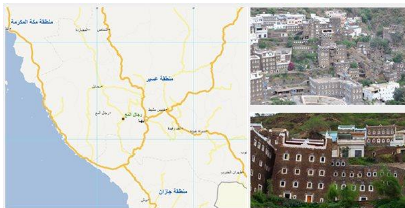
صورة رقم (7): لقرية رجال ألمع وموقعها على الخريطة ، مرجع الصورة رقم [14].

تقع قرية رجال المع في منطقة عسير في محافظة رجال ألمع، على بعد 54 كم غرب مدينة ابها التي تقع جنوب شرق المملكة العربية السعودية، وتتميز تلك المنطقة بالتضاريس الجبلية الخلابة الجاذبة للسياح. وتقع القرية على بعد 500 متر من الطريق الذي يربط بين مدينة محايل عسير ودرب بني شعبة. [14] كانت القرية تربط بين القادمين من اليمن وبلاد الشام مروراً بمكة المكرمة والمدينة المنورة، وهو ما جعلها مركزاً تجارياً مهماً في المنطقة. [3]