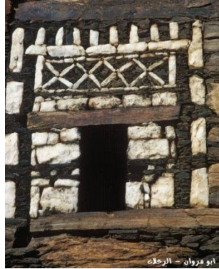
صورة رقم (9): استخدام حجر الكوارتز في تزيين الفتحات

وتتكون القرية من أربعة أحياء رئيسة، تشمل على 40 وحدة سكنية وتتنوع ما بين غرف مفردة ونزل وأجنحة فندقية واستراحات للزوار وقصور أشهرها قصور حاكم الدرعية ومعجب وجابر [11]، بالإضافة الى متحف القرية "المع الدائم للتراث" الذي بناه أهالي القرية منذ عام 1985، حيث اختاروا له حصن آل علوان والذي يعد من اكبر حصون القرية ويعود عمره لاربع قرون مضت، حيث تم ترميمه بالتعاون بين الأهالي وتولوا التبرع للمتحف بمقتنياتهم القديمة من أدوات وملابس تراثية واسلحة وقطع أثرية، وساهمت النساء بنقش الجدران الخارجية للقصر وتبرعوا للمتحف بحليهن من فضة وأدوات زينة وغيرها لعرضها في فترين المتحف. [22]